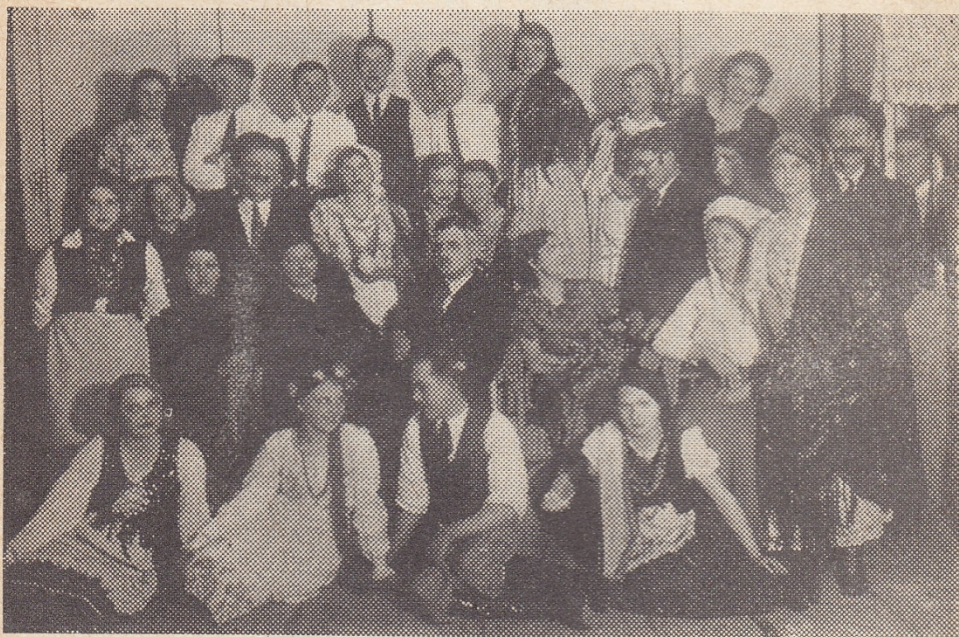
Chór Cukrowni „Zbiersk” w 1934 roku.