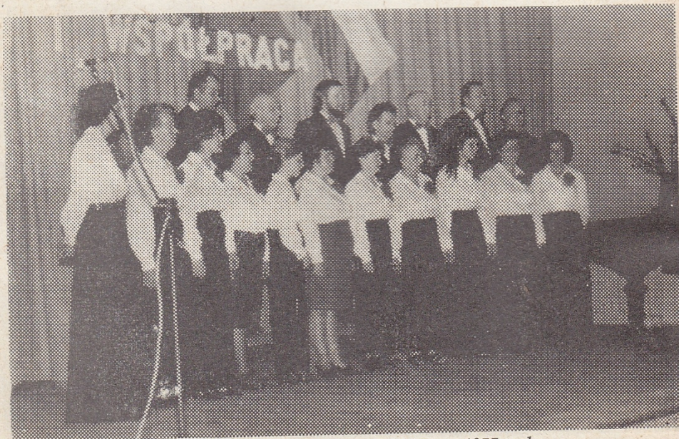
Spotkanie z delegacją ZSRR w 1977 roku.