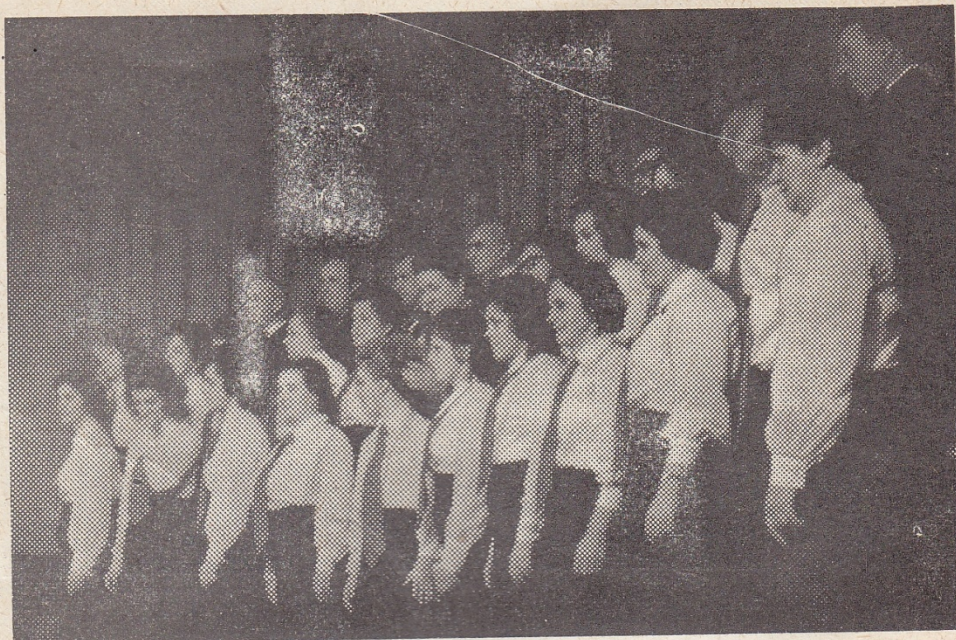
Występ podczas festynu z okazji 25-lecia pisma „Gromada — Rolnik Polski” w 1972 roku.