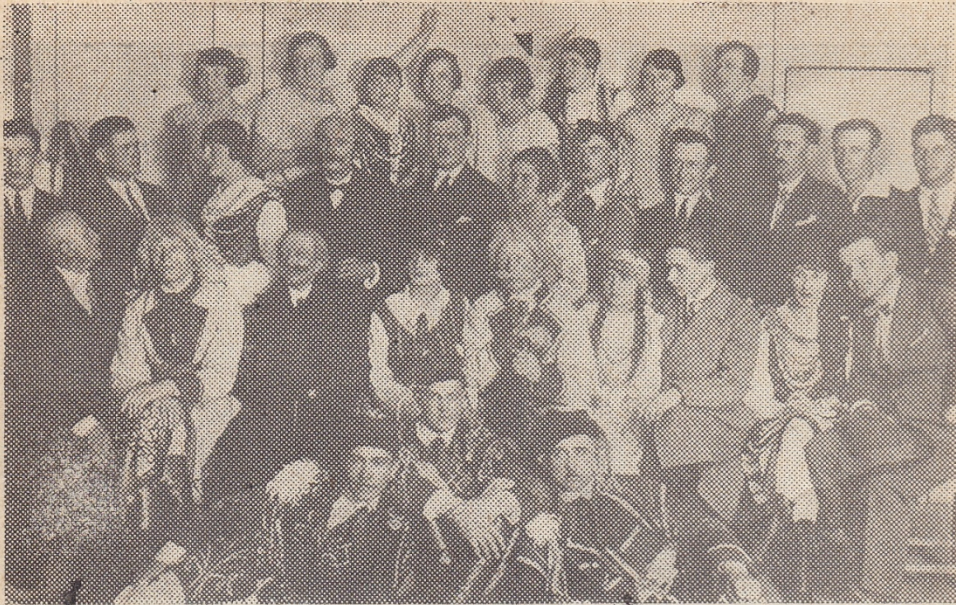
Chór Mieszany Cukrowni „Zbiersk” w 1928 roku.